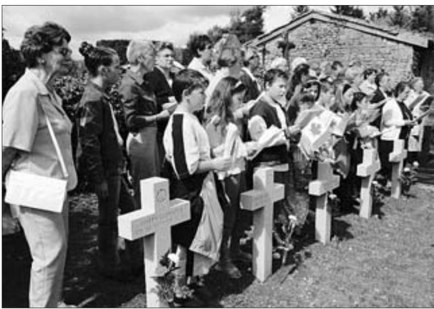
Les enfants des chorales de Marville et Montmédy ont chanté les hymnes nationaux. Dans leurs mains, des petits drapeaux canadiens qu'ils avaient réalisés pour l'occasion.

C'est une belle cérémonie, à la fois officielle et religieuse, qui a honoré la mémoire des Canadiens décédés à Marville et ses environs du temps de la base de l'Otan. Trente-sept ans après, l'amitié franco-canadienne perdure.