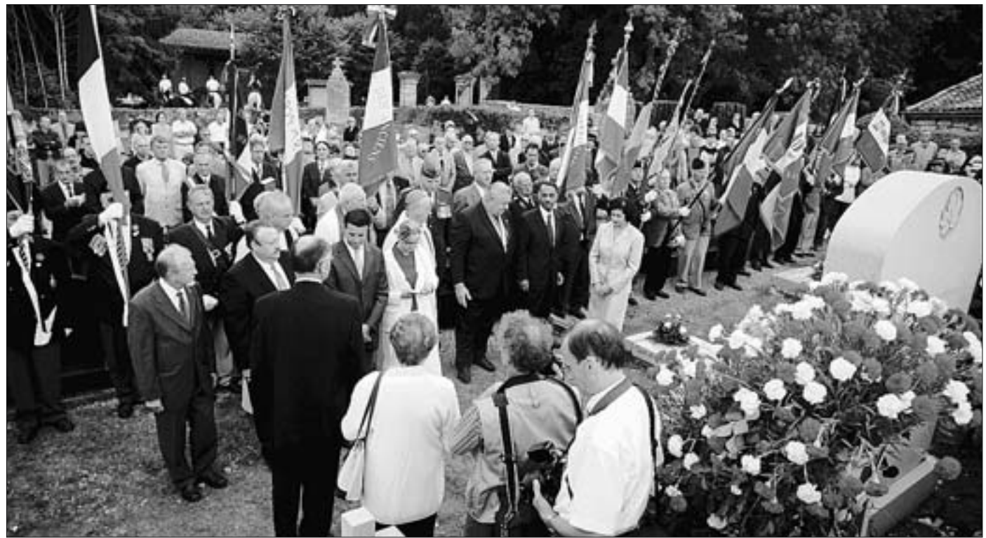
Au cimetière Saint-Hilaire, les autorités civiles, religieuses et militaires mais aussi les habitants de Marville et des environs, ont rendu hommage