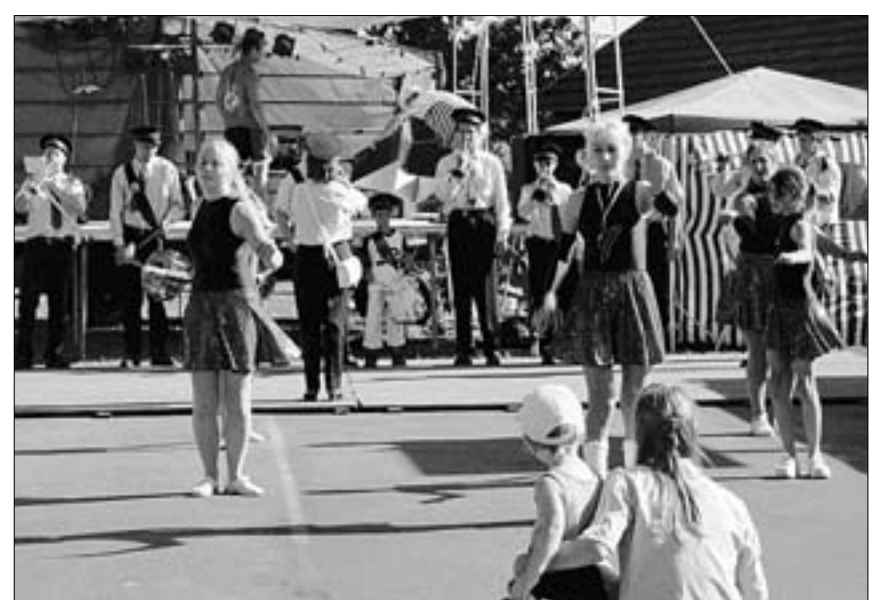
Karting, danse, majorettes, les animations n'ont pas manqué dimanche dernier.